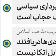
دیرپکل مجمع جهانی تقریب مذاهب اسلامی