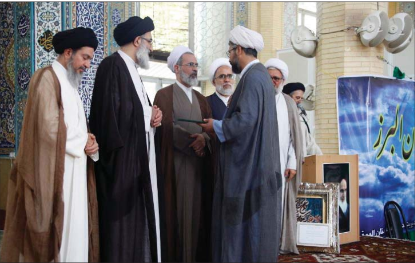
حوزه علمیه استان البرز را بهتر بشناسیم

■ موضوعی هم که از اهمیت ویژه‌ای برخوردار است، تبلیغات در شبکه‌های سراسری است، انتظار