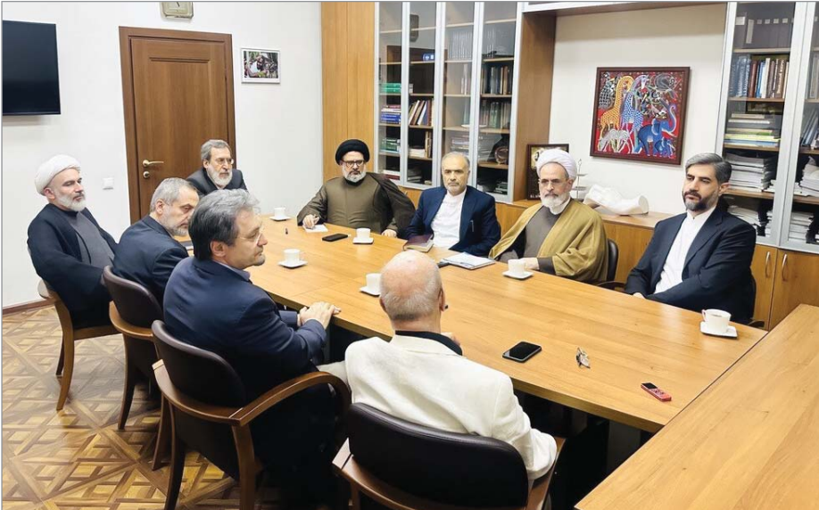
مدیرحوزه‌های علمیه در دیدار جمعی از اندیشمندان روسیه تصریح کرد