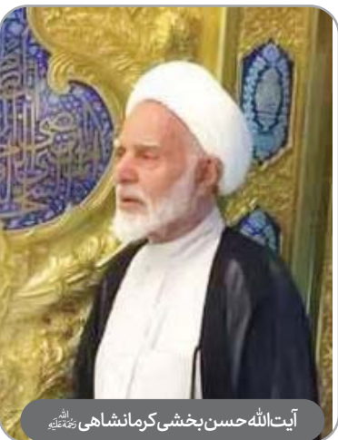
آیت‌الله حسن بخشی کرمانشاهی رحمته‌الله