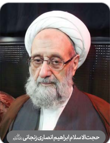
حجت‌الاسلام ابراهیم انصاری زنجانی رحمته‌الله