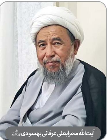
آیت‌الله محرابعلی عرفانی بهسودی رحمته‌الله