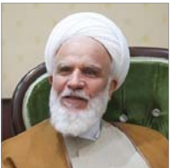
عضو مجمع تشخیص مصلحت نظام در گفت‌وگو با خبرگزاری حوزه