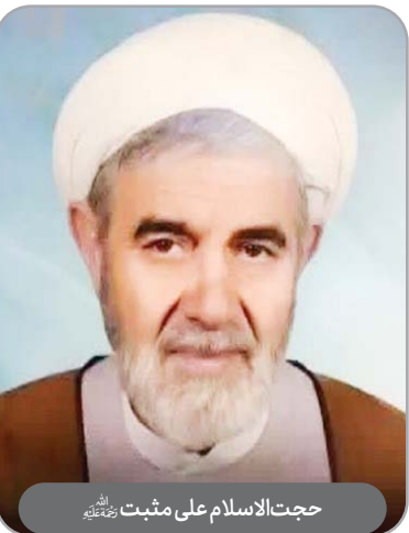
حجت‌الاسلام علی مثبت رحمته‌الله