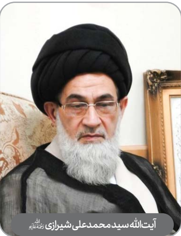
آیت‌الله سیدمحمدعلی شیرازی رحمته‌الله