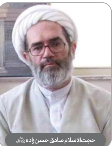
حجت‌الاسلام صادق حسن‌زاده رحمته‌الله

حجت‌الاسلام والمسلمین علی مثبت، معروف به فاضل همدانی، در سال ۱۳۲۴ هجری شمسی در شهر مقدس قم دیده به جهان گشود. وی از چهره‌های برجسته روحانی و انقلابی بود که عمر گران‌بهای خود را صرف خدمت به اسلام، انقلاب اسلامی، نظام جمهوری اسلامی ایران و مردم کرد و در عرصه‌های گوناگون دینی، علمی، اجتماعی، آموزشی و سیاسی، فعالیت‌های گسترده‌ای داشت و همواره با رویکردی ارزشی و انقلابی به ایفای نقش پرداخت. او در ادوار دوم و سوم مجلس شورای اسلامی، نماینده مردم شهرستان‌های بهار و کبودآهنگ بود و در این دوره‌ها، به‌عنوان یکی از نمایندگان فعال و دغدغه‌مند، به‌ویژه در حوزه مطالبه‌گری و احقاق حقوق مردم، شناخته می‌شد.