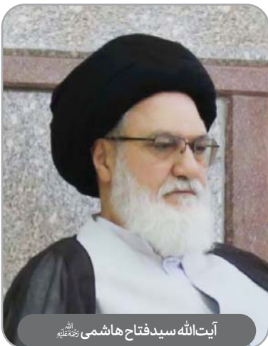
آیت‌الله سیدفتح‌الله هاشمی رحمته‌الله

آیت‌الله سید محمدعلی شیرازی، فرزند مرجع عالی‌قدر آیت‌الله‌العظمی سیدعبدالله شیرازی، در سال ۱۳۲۶ شمسی در نجف اشرف به دنیا آمد. در خانواده‌ای علمی و مذهبی پرورش یافت و از کودکی به تحصیل علوم دینی پرداخت. در سن ۱۳ سالگی به لباس روحانیت ملبس شد و در حوزه علمیه نجف به تحصیل و تدریس مشغول گردید. دروس مقدماتی و عالی‌تر را نزد اساتید بزرگی همچون آیت‌الله خویی و پدرش رحمته‌الله فراگرفت و در سن ۲۱ سالگی وارد درس خارج فقه و اصول شد. وی علاوه بر فعالیت‌های علمی، در مبارزات سیاسی علیه رژیم بعث عراق نقش فعالی داشت و بارها مورد تعقیب و بازداشت قرار گرفت. در سال ۱۳۵۴ شمسی، به همراه پدرش به ایران مهاجرت کرد و در مشهد ساکن شد. در جریان انقلاب اسلامی ایران، نقش مهمی در ارتباط با مراجع تقلید و رهبران مبارزه ایفا کرد و به‌عنوان پل ارتباطی بین آیت‌الله‌العظمی شیرازی و دیگر مراجع عمل نمود.