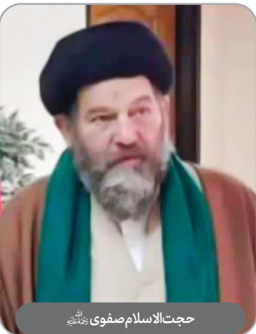
حجت‌الاسلام صفوی رحمته‌الله