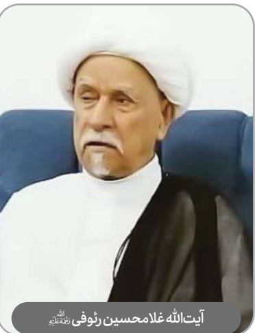
آیت‌الله غلامحسین رثوفی رحمته‌الله