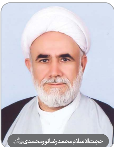
حجت‌الاسلام محمدرضانورمحمدی رحمته‌الله