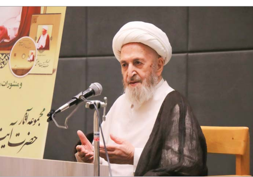
وسائل‌الشیعه، ج ۱۱۷، ص ۳۷۹

ای ابودر! پیش از آنکه به حسابت برسند، خودت به حساب خود برس که این کار، حساب فردای تو را آسان تر می‌کند و پیش از آنکه تو (و عمل تو) را وزن کنند، خودت را وزن کن و آماده عرضه بزرگ آن روز باش که تو را عرضه می‌کنند و آن روز، هیچ کار پنهانی بر خداوند پوشیده نمی‌ماند.