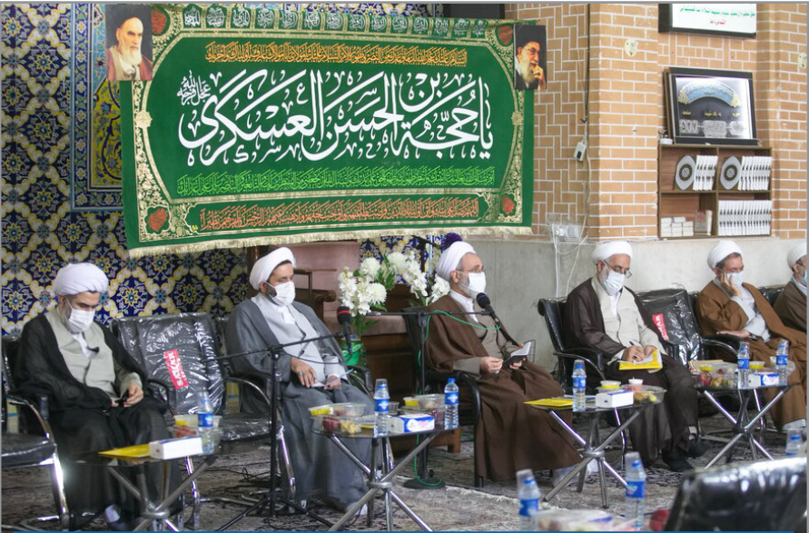
آیت‌الله اعرافی در نشست مدیران مدارس سطح یک قم

حجت‌الاسلام والمسلمین همتیان با بیان اینکه فضای مجازی و ارتباط با مدارس آموزش و پرورش دو رویکرد در بحث جذب افراد مستعد برای ورود به حوزه است، به مسئله تهذیب اشاره کرد و گفت: یکی از کارهایی که در این زمینه انجام شده، دانش‌افزایی مدیران است و این مسئله‌ای است که به‌زودی اتفاق می‌افتد.