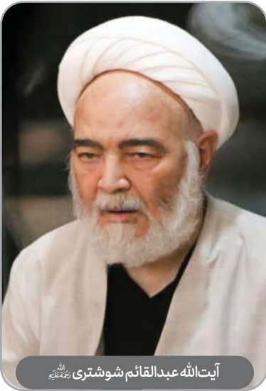
آیت‌الله عبدالقائم شوشتری رحمته‌الله