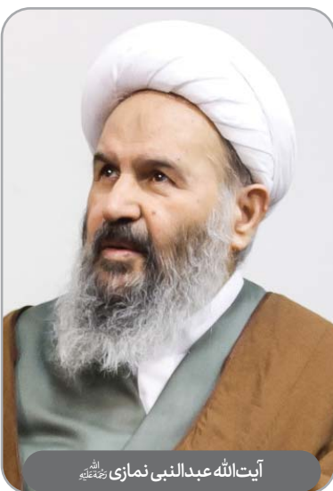
آیت‌الله عبدالنبی نمازی رحمته‌الله