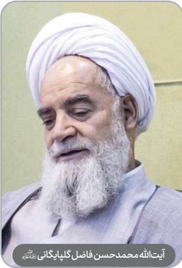
آیت‌الله محمدحسن فاضل گلپایگانی رحمته‌الله