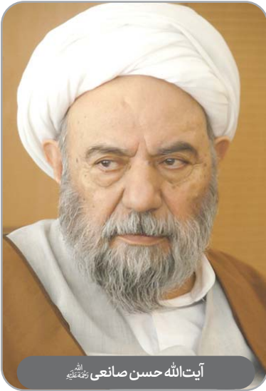
آیت‌الله حسن صانعی رحمته‌الله