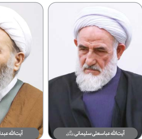
آیت‌الله عباسعلی سلیمانی رحمته‌الله

محسن‌علی نجفی در سال ۱۹۴۳م در ۶۰ کیلومتری اسکردو بَلَّتِشْتان پاکستان در ناحیه کُهرْمَنگ در روستایی به‌نام مَنثُوکِه به‌دنیا آمد. پدرش حسین‌جان از علمای آن منطقه بود.